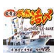
活躍中の第83 康進丸 "根室市歯舞群島"

「あいよ寿司」と「あいよ魚菜館」は、創業以来から今日まで「旬鮮粋彩」を営業のキーワードにして、高品質の旨味フードの本来の魚介類をお届け中です。鮮度保持には漁獲後の活マメ締めとは異殺すの意）する早期処理のレベルを決まりです。魚の旨味は、魚をマメたあと生成（イノシン酸・アデニン酸）が旨味となり、「美味の魚」となります。北の漁場で漁獲された活きた魚が「船上で活マメされ丁寧」に保存。その魚が、船上処理後、迅速物流で翌日に、水戸のあいよ寿司に到着しています。