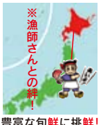
豊富な旬鮮に挑戦！

「あいよ寿司」と「あいよ魚菜館」は、創業以来から今日まで「旬鮮粋彩」を営業のキーワードにして、高品質の旨味フードの本来の魚介類をお届け中です。鮮度保持には漁獲後の活マメ締めとは異殺すの意）する早期処理のレベルを決まりです。魚の旨味は、魚をマメたあと生成（イノシン酸・アデニン酸）が旨味となり、「美味の魚」となります。北の漁場で漁獲された活きた魚が「船上で活マメされ丁寧」に保存。その魚が、船上処理後、迅速物流で翌日に、水戸のあいよ寿司に到着しています。