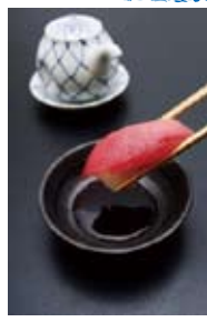
トトロたくあん巻