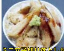
ミニ穴子切り落とし丼

■お好きなミニ丼とお寿司の2味を満喫！ ■ミニ中落ち丼・・・¥240 ■ミニ数の子(バラ)丼・・・¥240 ■ミニ穴子切り落とし丼・・・¥300