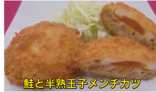
鮭と半熟玉子メンチカツ