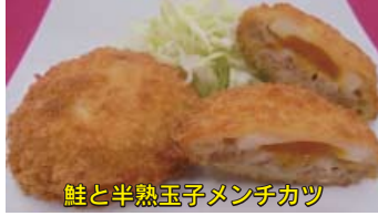
鮭と半熟玉子メンチカツ